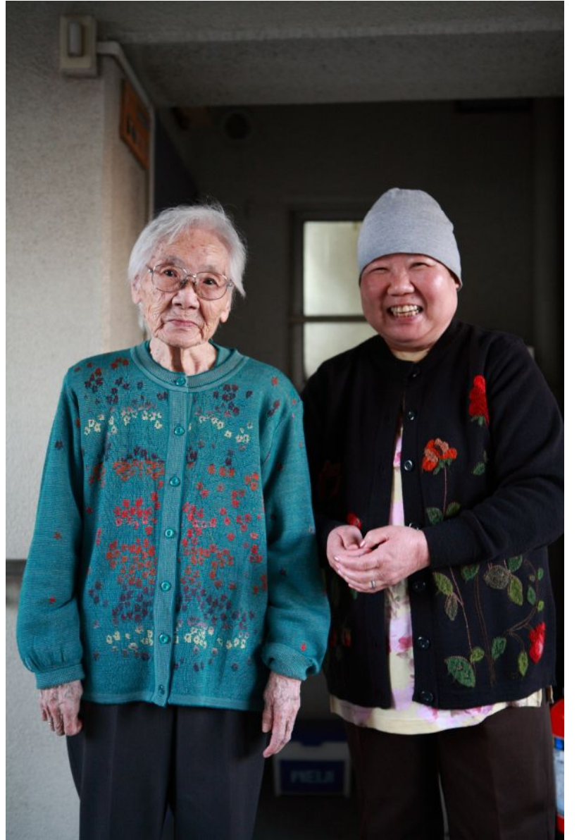
無事、家族にお届け。ありがとうございますの言葉。

こんにちは。前回、お休みをいただきみなさまお待ちかね？の復活の第一弾です。幸区小倉にあるデイサービスバナナ園に行ってきました。認知症専門の少人数型で行き届いたサービスとアットホームな雰囲気が特徴です。入浴や食事のお世話や機能訓練などご家族が変わってお世話をしてくれます。自宅に閉じこもりがちな要介護者が心身状態の維持や向上が図れる他、家族の方々の負担の軽減にもなりますね。今回は夕方のお送りの時の風景をお届けします。今日のお客様は全部で5人の方々です。帰り間際の体操で身体をほぐしていました。なんだかみなさん動きが軽快です。そういえば小学校の帰りの会では、もうすぐ家に帰れると喜んだなあ。やはりみなさんお家が好きなんでしょうかね。利用者同士で楽しい時間を過ごしたり、歌を唄ったりして、スタッフの方々との交流で刺激を得れば気分転換にもなり機嫌も良くなったり。スタッフのみなさんは、きちんと安全第一で無事送り届けるまでは緊張、緊張の日でしょうね。無事故につながるのもチームワークの良さの賜物だと思いました