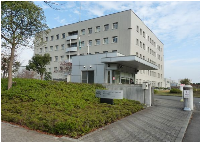
久里浜にある研究所。数々の新製品がここから生み出されます。