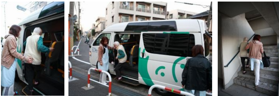
(左) 足腰の弱い方がおおいのでしっかりとサポート。 (中) 無事到着です。おりるときもしっかりサポート。 (下) 二階までは運動のため階段で上がります。ここでもサポートはしっかりと。