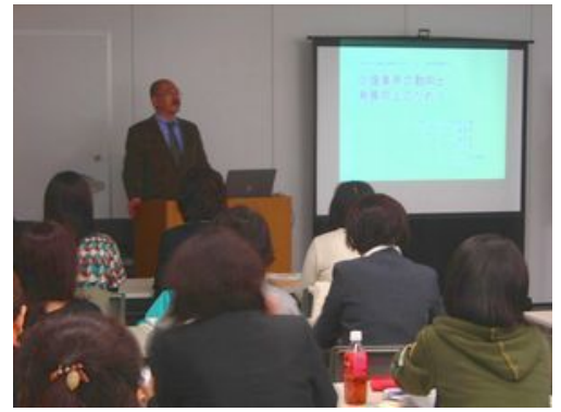
昨年ミュージアム川崎にて開催の様様