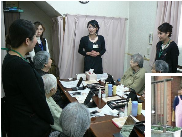
最初は皆さん緊張の表情でした... 幸区の第一バナナ園にて